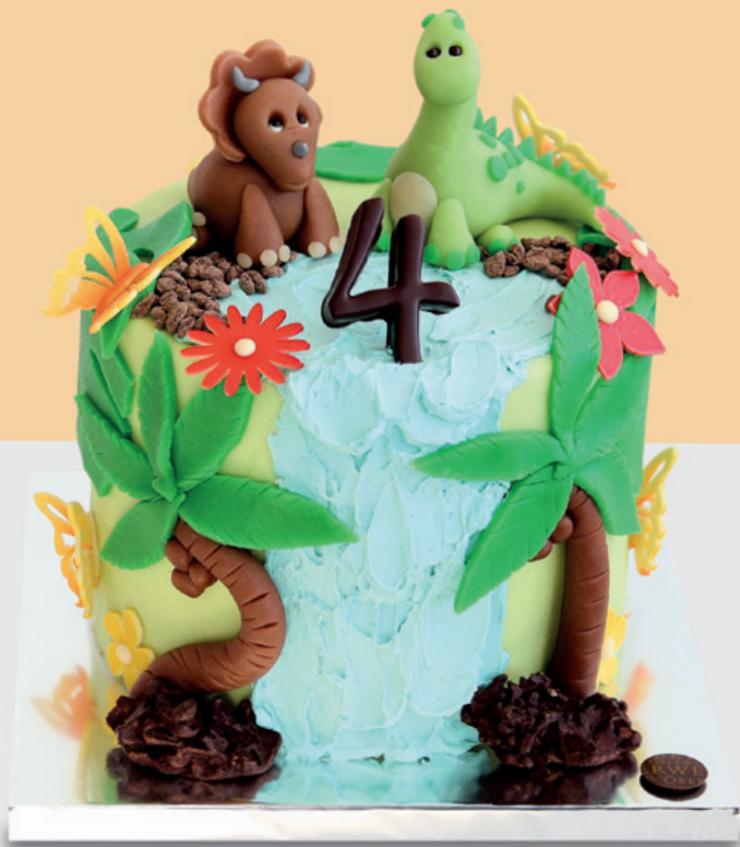
Taille unique 12 personnes