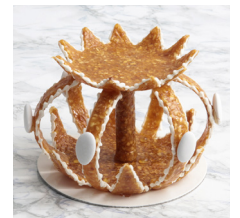
Couronne en croquant