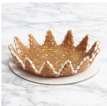
Assiette en croquant